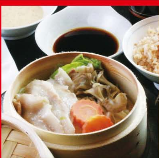
湧水ポークと季節野菜のせいろ蒸しとろろ御膳