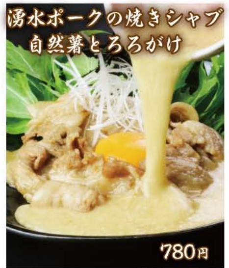
湧水ポークの焼きシャブ 自然薯とろろがけ