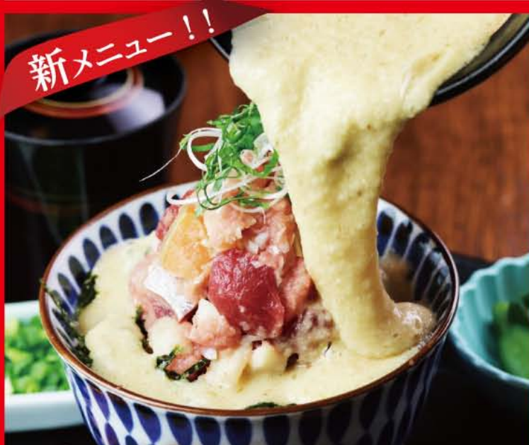
富士山盛り海鮮麦とろ御膳