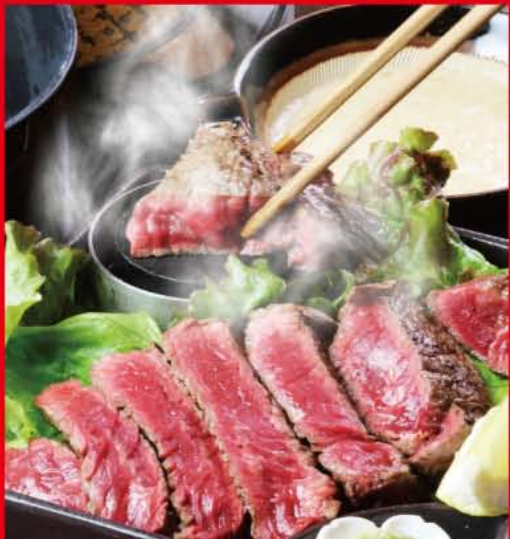
国産赤身ステーキと麦とろ御膳