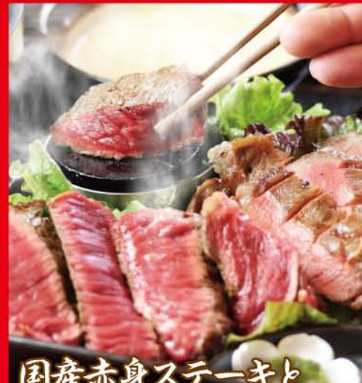
国産赤身ステーキと牛タンの麦とろパワー御膳