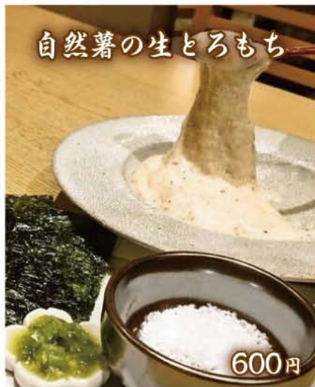
自然薯の生とろもち